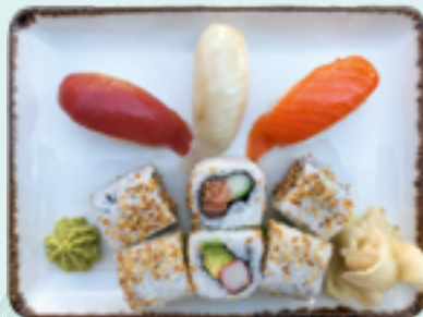
Menü 4 : ALAS 1,D 16,90€ 3 Nigiri: Thunfisch, Lachs, Weißfisch; 3 California, 3 Alaska