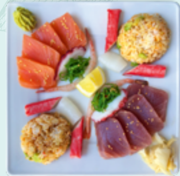
61 : SASHIMI BDFL 23,90€ Verschiedenes Fischfilet mit Reis