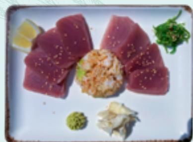
63: THUNFISCH SASHIMI D 21,90€