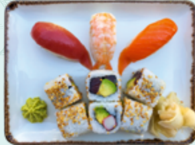
Menü 6 : TOM 1,BD 16,90€ 3 Nigiri: Thunfisch, Lachs, Garnele; 3 California, 3 Michell