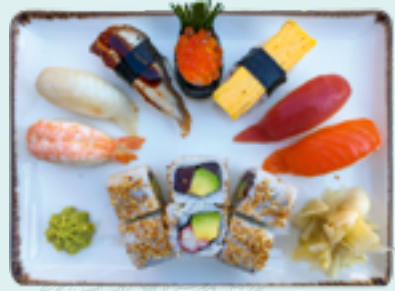
Menü 12 : LUCKY 1,BCDL 22,90€ 7 Nigiri: Thunfisch, Lachs, Weißfisch, Garnele, Flusaaal, Eierstich, Lachskaviar; 3 Cali., 3 Michell