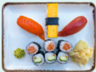
Menü 3 : TAM CDE 15,90€ 3 Nigiri: Thunfisch, Lachs, Eierstich; 3 Lachs, 3 Gurke