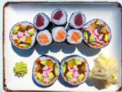
Menü 2 : FULL D,11 15,90€ 3 Thunfisch, 3 Lachs, 4 Futo Maki