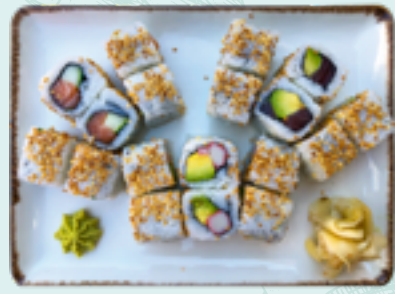
Menü 10 : URA 1,D 18,90€ 6 Alaska, 6 Michell, 6 California