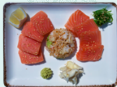
62: LACHS SASHIMI D 19,90€