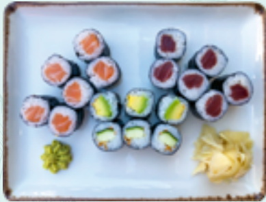
Menü 1 : HOSO DL 15,90€ 6 Thunfisch, 3 Avocado, 6 Lachs, 3 Gurke

zu jedem Menü servieren wir Ingwer, Wasabi 1,16 und Sojasoße 1,F