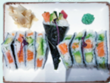
Menü 19 : SANDWICHES ADG 20,90€ Temaki mit verschiedenen Sorten 8 Sandwiches: Lachs und Avocado