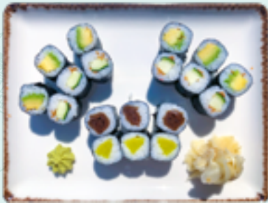
Menü 13 : VEGETABLE 11,L 14,90€ 3 Kürbis, 6 Avocado, 3 Rettich, 6 Gurken