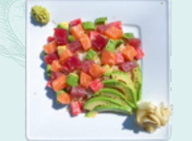
Menü 16 : KAISER DON 1,CD 18,90€ Reis mit Sesam, Fliegenfischkaviar, Thunfisch, Lachs, Krabbenimitat, Avocado