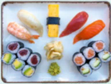
Menü 11 : GAIN BCDL 19,90€ 5 Nigiri: Thunfisch, Lachs, Weißfisch, Garnele, Eierstich; 3 Thunfisch, 3 Avo, 3 Lachs, 3 Gurke