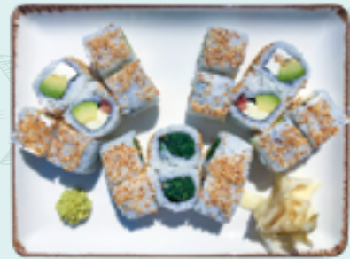
Menü 14 : UNO GL 17,90€ 6 Mozzarella, 6 Spinat, 6 Frischkäse