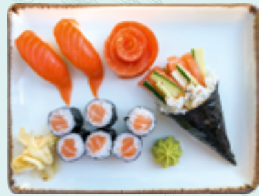
Menü 18 : SALMON DL 18,90€ Lachs: 2 Nigiri, 6 Maki, Temaki und Sashimi