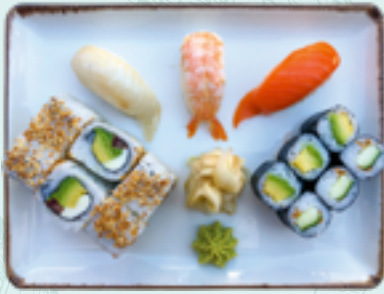
Menü 9 : ITALIEN BDG 18,90€ 3 Nigiri: Lachs, Garnele, Weißfisch; 3 Gurke, 3 Avocado, 6 Italien