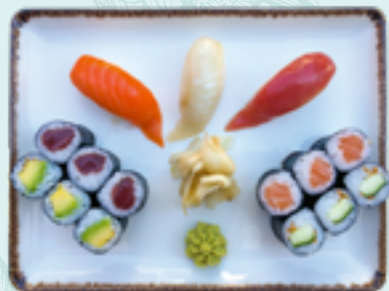
Menü 7 : JO DL 16,90€ 3 Nigiri: Thunfisch, Lachs, Weißfisch; 3 Avocado, 3 Thunfisch, 3 Gurke, 3 Lachs