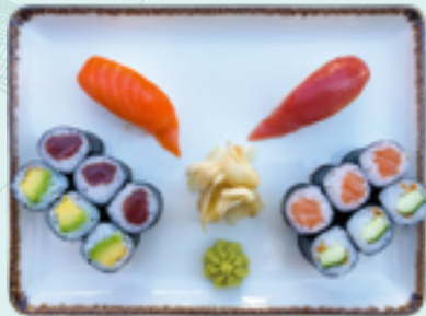
Menü 5 : BEI DL 15,90€ 2 Nigiri: Thunfisch, Lachs; 3 Lachs, 3 Thunfisch, 3 Avocado, 3 Gurke