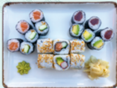
Menü 8 : MIXED 1,DL 16,90€ 3 Avocado, 3 Thunfisch, 3 Gurke, 3 Lachs, 3 California, 3 Alaska