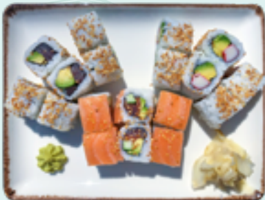
Menü 15 : BIG 1,D 19,90€ 6 Michell, 6 California, 6 Rainbow-Lachs