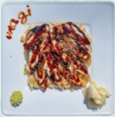
Menü 17 : UNAGI DON L 18,90€ Reis mit Flussaal